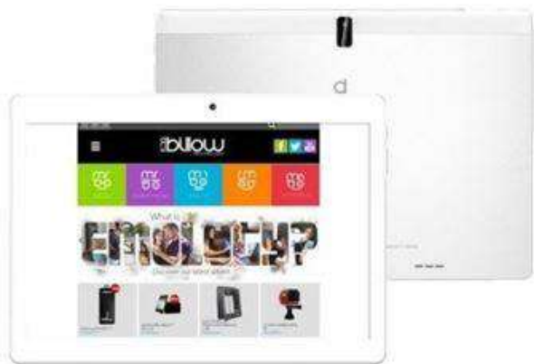
8 Tablets Quad Core Billw 10.1”