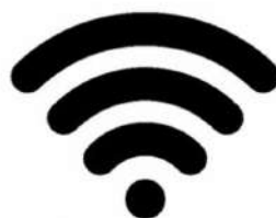
Wi-Fi Conexión Wifi para las tablets