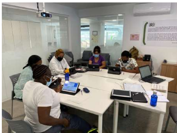
Sala de Formación aforo para 6 alumnos