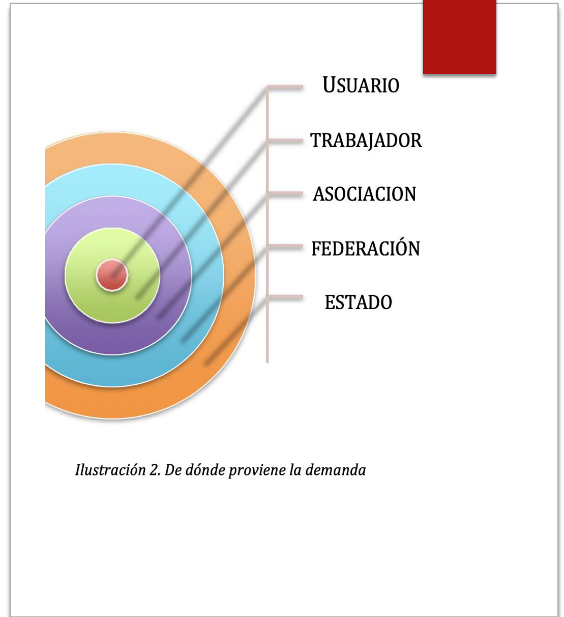
Ilustración 2. De dónde proviene la demanda